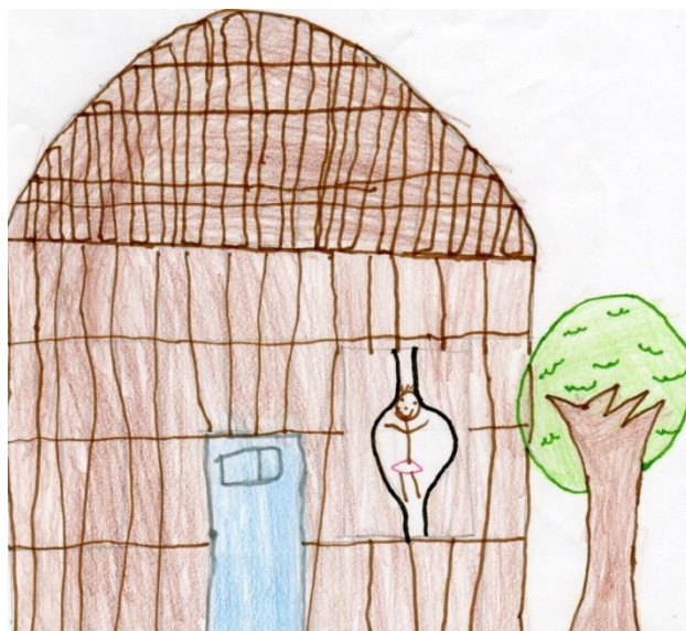
Figura 4: desenho que representa a concepção generalizada de moradia