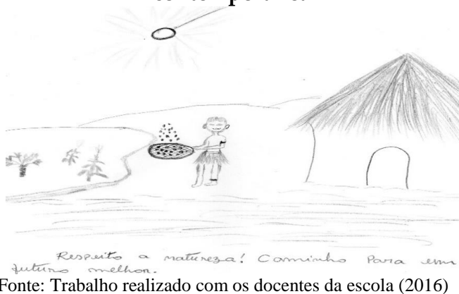
Figura 2: Imagem que alude um ser a parte da sociedade contemporânea

Ao analisarmos os desenhos produzidos pelos docentes, observamos uma visão estereotipada e preconceituosa, que representa o índio originário, natural e cristalizado. Apesar da tentativa da maioria representá-lo diferentemente na escrita, ocorreu ainda os que não conseguiram, evidenciá-los no presente, como apareceu em um dos desenhos que revelou ao escrever à Natureza, o Ambiente e sequer apareceu o nome índio. O indígena foi colocado como habitante do Brasil, como se os povos indígenas não antecedessem a história colonial. Como visualizamos nas Figuras 3.