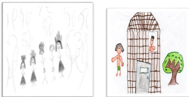
Figura 1: Desenhos, remetendo ao diferente, a generalização e a naturalização